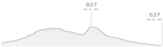
Cíl etapy - trasa pro auto

13.6km, 40% asfalt, 40% lesní cesta, 20 % trail, stoupání 356m, klesání 401m